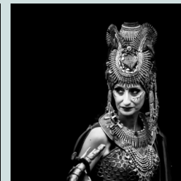
Primer premio Blas Carrión Guardiola Retrato I - II - III